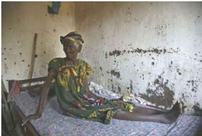
vieillards abandonnés du Sud Kivu

L'association met l'accent aussi sur le respect des droits civils et politiques, la lutte contre l'impunité, et la condition pénitentiaire.