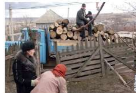
La livraison de bois de chauffage, indispensable pour survivre à la rigueur des hivers moldaves.