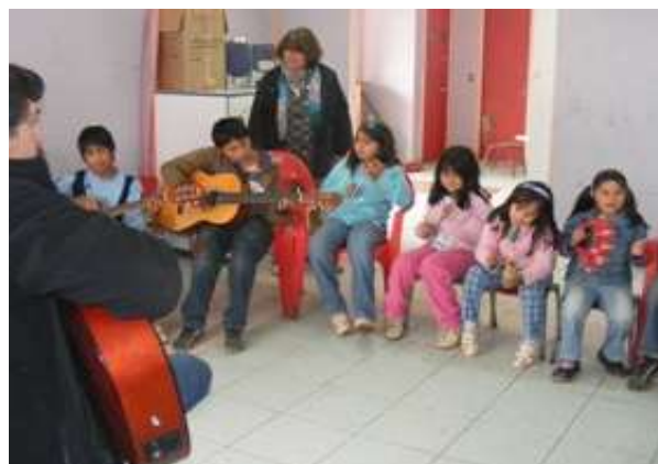
Atelier de musique