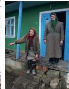
Des repas sont livrés à domicile pour les personnes qui ne peuvent pas se déplacer.

C'est pour pallier ces manques que l'association moldave Compassiune , en partenariat avec l'association suisse Vivere , et le soutien de la municipalité de Costesti, a créé un projet de cantine sociale. Les objectifs sont multiples: offrir un repas chaud aux personnes âgées, à midi et le soir, livrer des repas à domicile pour les personnes qui ne sont pas mobiles, fournir du bois de chauffage pour l'hiver, et trouver un toit aux sans-abris. Cette solidarité rappelle aux retraités moldaves qu'ils sont en vie et qu'ils ne sont pas seuls. Ils sont intégrés à la communauté, peuvent participer à des programmes d'activités et trouvent le dialogue et le réconfort dont ils ont besoin.