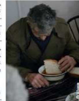
La cantine sert 36 repas par jour.

À Costesti, les personnes âgées sont pauvres, isolées, et doivent souvent s'occuper de leurs petits enfants. L'Etat leur verse une maigre retraite (12 € par mois) qui ne couvre pas leurs besoins quotidiens, en particulier les soins médicaux pour soulager les maladies et handicaps de la vieillesse. Les hôpitaux sont éloignés, les services trop chers et l'équipement vétuste. Sans aide, de nombreuses personnes âgées risquent de manquer de nourriture et de bois de chauffage indispensables à leur survie.