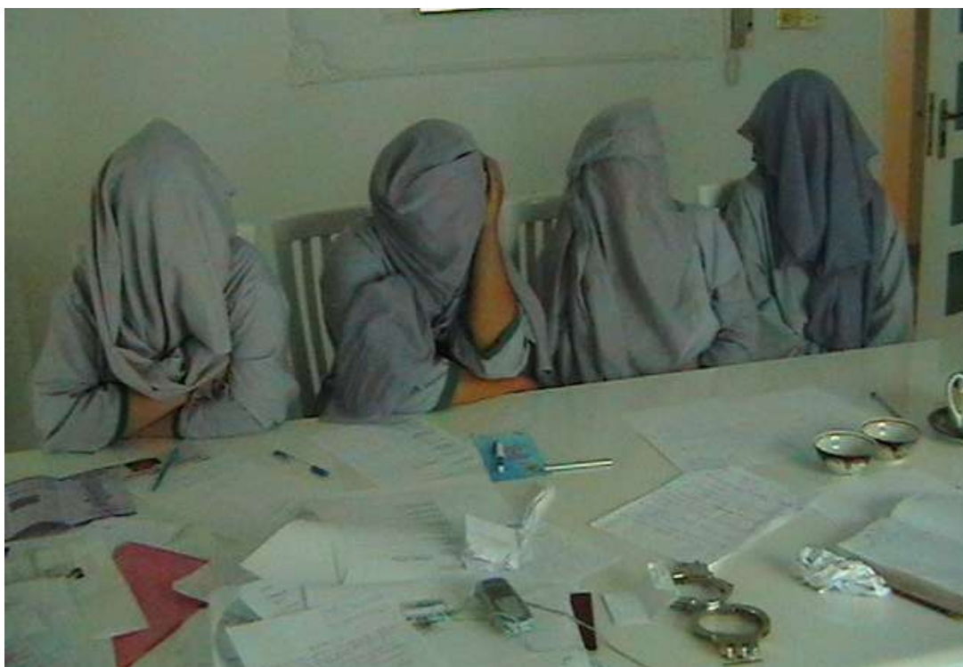
Victimes du trafic des êtres humains en attente de rapatriement