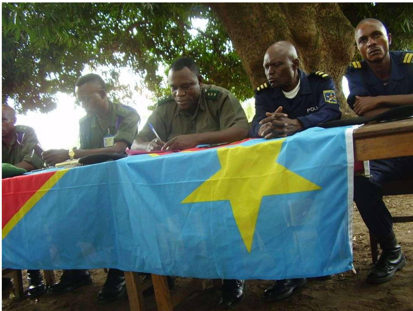
Chambre foraine de l'auditorat militaire, le Tribunal